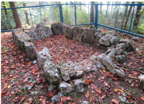
Dolmengrab von Aesch